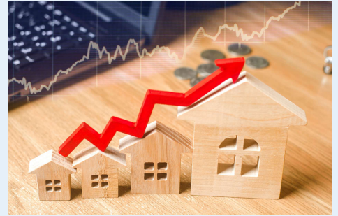
不動産賃貸料 and more...